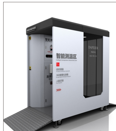
型号：DFE-HB03 (移动测温消毒通道)